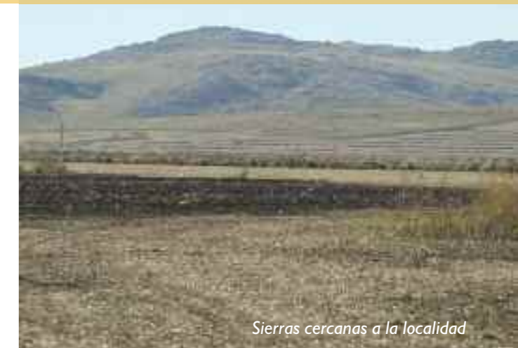
Sierras cercanas a la localidad

Cuenta con varias instituciones que llevan adelante el crecimiento de la localidad, como la Biblioteca Popular "José Ingenieros", con 190 socios y más de 10.000 volúmenes, los Bomberos Voluntarios, el Hospital "Enrique Rodríguez Larreta" cuya comisión esta formada por un