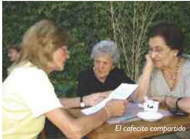
El cafecito compartido

crecimiento para el adulto. Para reforzar estos conceptos, el especialista comenta que: “En Inglaterra se realizó una encuesta que abarcó 80 países y que dio como resultado que las dos edades más felices son los 20 y 70. Llama la atención, pero es la segunda investigación que obtiene el mismo resultado” .