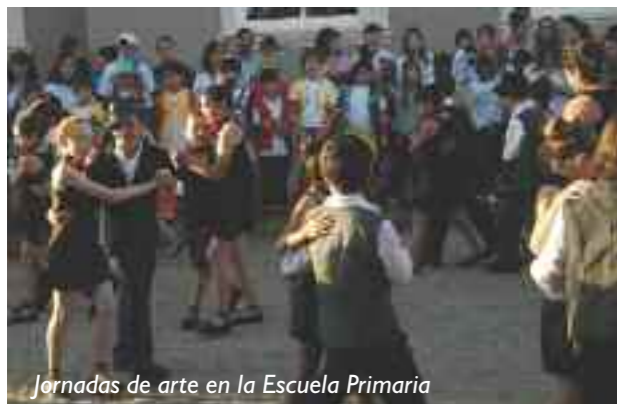
Jornadas de arte en la Escuela Primaria

de leche. Esto dio lugar a la organización de la Primera Fiesta del Dulce de Leche Artesanal, que este año verá su VII edición. Por otro lado, a través de la iniciativa de preservación del patrimonio cultural, la escuela lleva adelante el Museo y Archivo Histórico Dr. Aurelio de Lusarreta, que cuenta con más de mil piezas, así como el Museo de Maquinarias Agrícolas "E. A. Ferrer". Finalmente posee un proyecto de agroturismo como posibilidad de reconversión productiva, por medio del cual se relevó la mayoría de los espacios turísticos de María Ignacia y zona aledañas. Aunque no perduró en el tiempo, estos esfuerzos han dado un puntapié inicial de gran trascendencia e importancia y gracias a ellos el turismo ya se empieza a ver como una alternativa de desarrollo local que permita crecer en el plano económico y cultural.