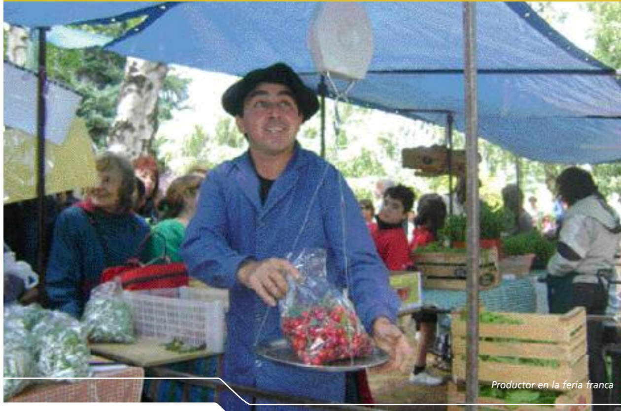
Productor en la feria franca

LA SOBERANÍA ALIMENTARIA SOSTIENE QUE CADA PUEBLO ES LIBRE PARA DECIDIR LA FORMA DE PRODUCIR Y CONSUMIR LOS ALIMENTOS EN EL MARCO DE SU PROPIA CULTURA.