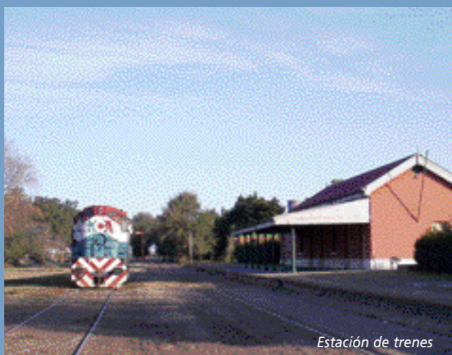
Estación de trenes