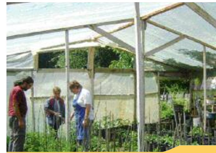
Trabajando en la huerta

La cátedra empezó su trabajo realizando seminarios y transferencia del conocimiento a familias productoras y en la actualidad es una actividad complementaria a las carreras de grado de las facultades, que busca formar profesionales comprometidos. Por otro lado, tiene presencia permanente en congresos y encuentros regionales, nacionales e internacionales para incluir la soberanía alimentaria en las mesas de debate.