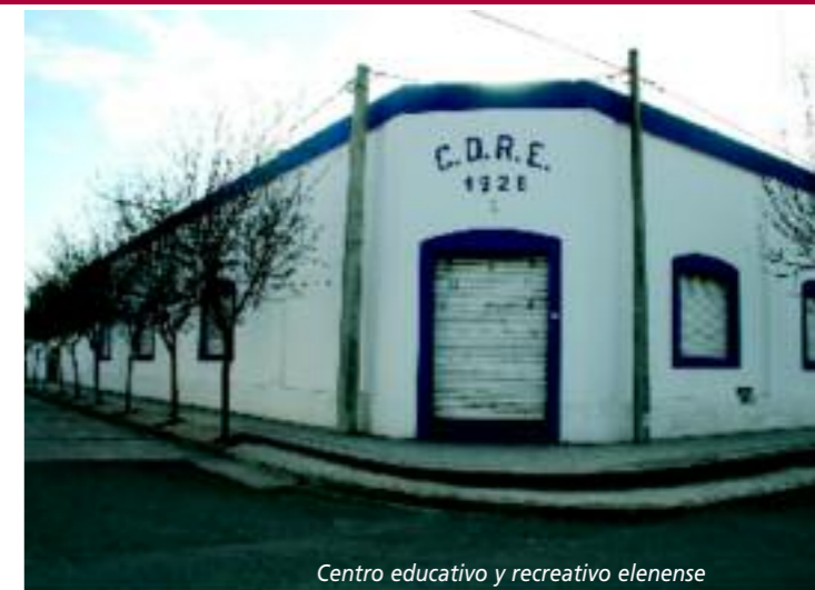
Centro educativo y recreativo elenense

Con respecto a las instituciones, se destaca la escuela especial Santa Elena, cuya inauguración fue un gran avance para la localidad. Esta comenzó brindando educación a personas con capacidades diferentes y en la actualidad amplió sus actividades, ofreciendo también atención temprana y formación laboral. Con la colaboración del municipio y aporte privado, construyeron un edificio donde funciona el "Taller de