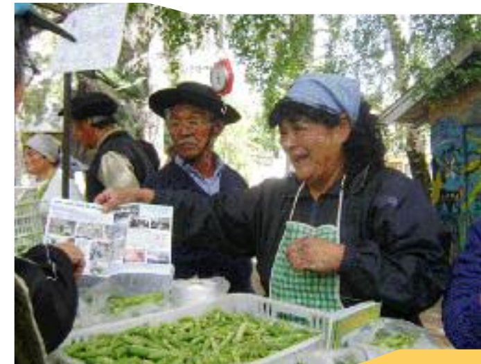
Informando sobre la producción

Belo agrega a estas ideas otro elemento que no es menor: la importancia de una buena nutrición como un instrumento para la prevención en salud y explica que para quienes defienden estas ideas, las exportaciones recién pueden realizarse cuando ya están satisfechas las necesidades de consumo de todo el país. Asimismo, el concepto está en contra de la concentración de los capitales en la producción, propiedad y alquiler de la tierra, así como de los cultivos transgénicos.