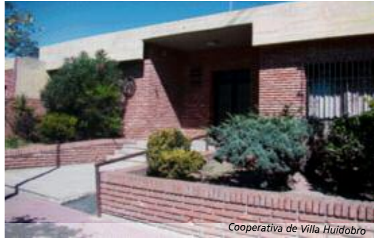
Cooperativa de Villa Huidobro

Lila se realizó con una técnica de animación denominada "stop-motion" a través de muñecos de plastilina. En el corto, la protagonista, una niña llamada Lila, dialoga con una gotita de agua que le explica de qué manera llega desde el río hasta su casa y la necesidad de cuidar el recurso porque se está agotando en el planeta. A través del corto, los chicos podrán conocer todo el proceso de purificación del agua desde donde se la extrae del río hasta las cañillas de sus hogares. El video es muy atractivo para los pequeños ya que el lenguaje es simple y las imágenes en plastilina le aportan una dinámica distinta.