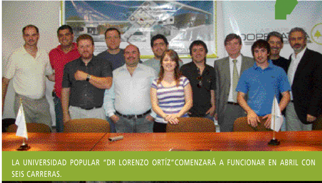
LA UNIVERSIDAD POPULAR "DR LORENZO ORTÍZ" COMENZARÁ A FUNCIONAR EN ABRIL CON SEIS CARRERAS.

Ya es un hecho la creación de esta institución educativa, que nació con el objetivo de generar más opciones en la oferta académica tanto de Las Varillas como de la región.