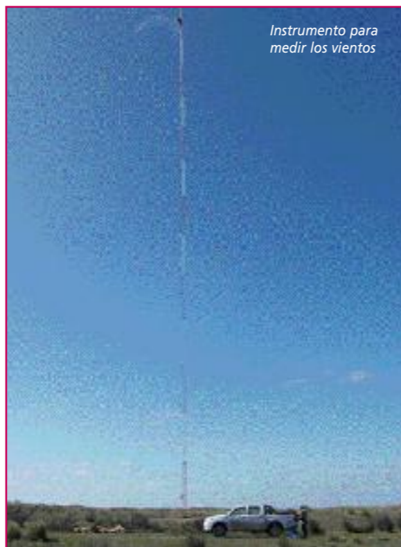
Instrumento para medir los vientos

En este proyecto integral, la cooperativa está realizando las acciones para que cada casa genere su propia energía. Así, busca convertirse en proveedora del equipamiento necesario, así como generar financiamiento que permita que estos instrumentos lleguen al socio sin un gran impacto en su economía. "Una parte de la inversión se amortiza con lo que se abona por el consumo mensual y lo interesante es que el equipo dura varios años. Cuando