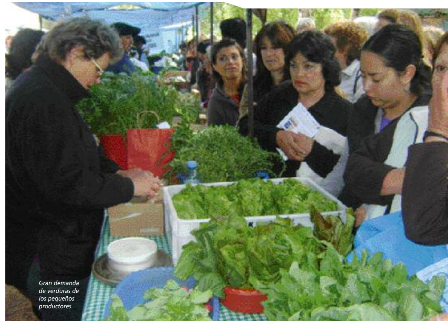
Gran demanda de verduras de los pequeños productores

Para Vía Campesina, la soberanía alimentaria también incluye el acceso de los campesinos al agua, a la tierra, a las semillas y al crédito. De allí es que impulsan la necesidad de reformas agrarias, la lucha contra los organismos genéticamente modificados para el libre acceso a las semillas y la búsqueda por mantener el agua en su calidad de bien público, repartiéndola de una forma sustentable. En este sentido y observando a Argentina, se asegura que aunque hoy existen varios programas de incentivo, hacen falta más políticas que posibiliten tanto el acceso como la facultad de mantener los minifundios. "Argentina tenía 450.000 establecimientos agropecuarios pequeños o medianos. En pocos años se perdieron 120.000, que comenzaron a desaparecer en los '90, mientras que en Brasil, por ejemplo, se generó un plan que comprende tanto a los grandes productores como a los modelos de producción agroecológica, impulsando el acceso a las tierras" -asegura Pengue.